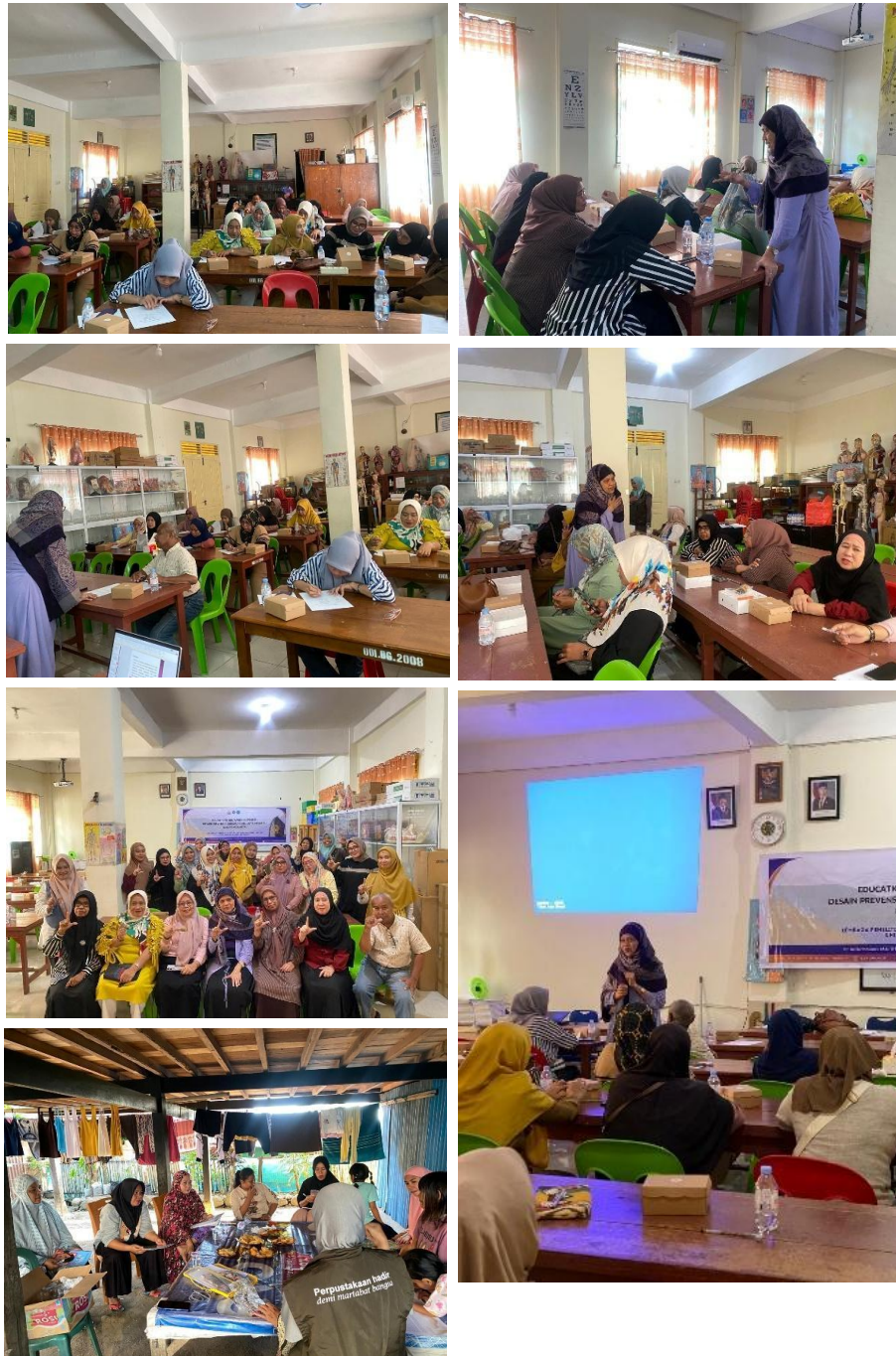
Gambar 4. Kegiatan Penelitian

Terima kasih kepada pihak-pihak yang telah membantu jalannya penelitian ini.