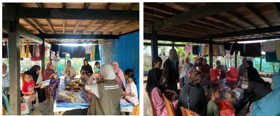
Gambar 5. Kegiatan Penelitian